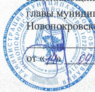
Схема теплоснабжения Новопокровского района на 2025-2030 годы (с перспективой до 2045 г.)