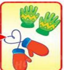
перчатки или варежки