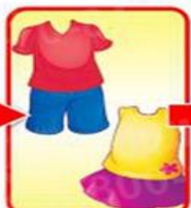
майка+шорты или платье